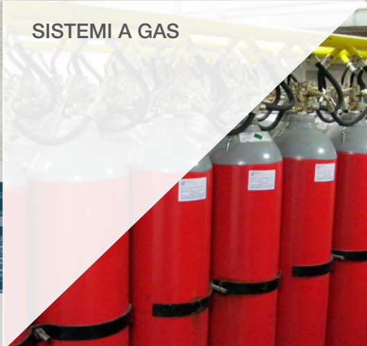
SISTEMI A GAS