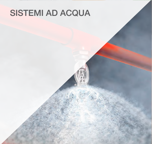
SISTEMI AD ACQUA