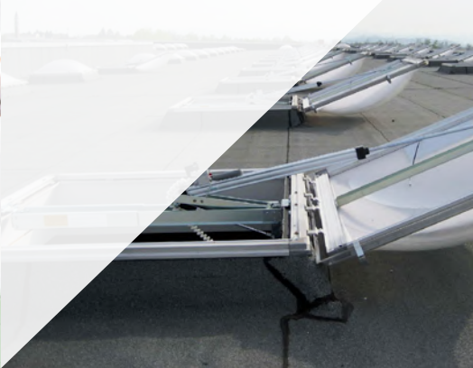
SISTEMI DI EVACUAZIONE FUMO E CALORE