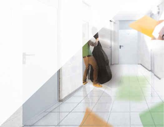
PORTE NON TAGLIAFUOCO