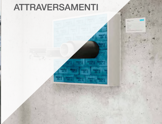
BARRIERE PASSIVE TAGLIAFIAMMA PER ATTRAVERSAMENTI