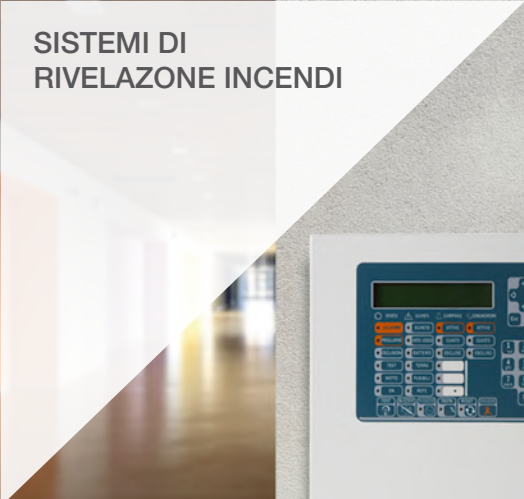
SISTEMI DI RIVELAZIONE INCENDI