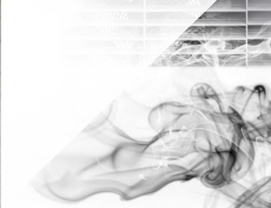
SISTEMI DI AEREAZIONE FORZATA